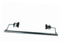
DIS MR SUP G INO