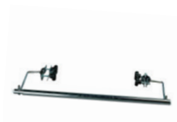
DIS MR SUP G INO