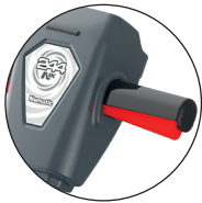
Essentiële elementen en 'touch points' in rood