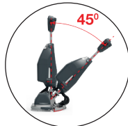
Vrij beweegbare hendel met parkeerstand