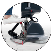
Bediening zuigmond met de voet

Reinigingsprestaties in één handeling worden bereikt door een combinatie van borsteldruk, krachtige aandrijfmotoren en de juiste hoeveelheid water op de juiste plaats. Overschakelen op de 244NX levert bij een gebruik van 5 minuten per dag al een besparing op waardoor de machinekosten al in 3 jaar kunnen worden terugverdiend.