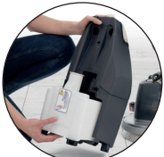
Gemakkelijk vullen en legen van tanks