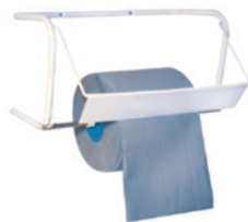
DIS IR WAL W MET