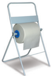
DIS IR FLO W MET